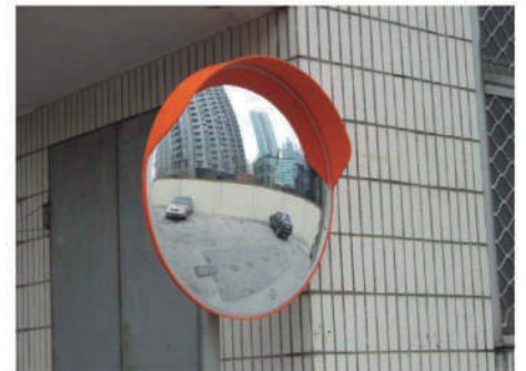
PARA ESPEJO DE 60 CMS